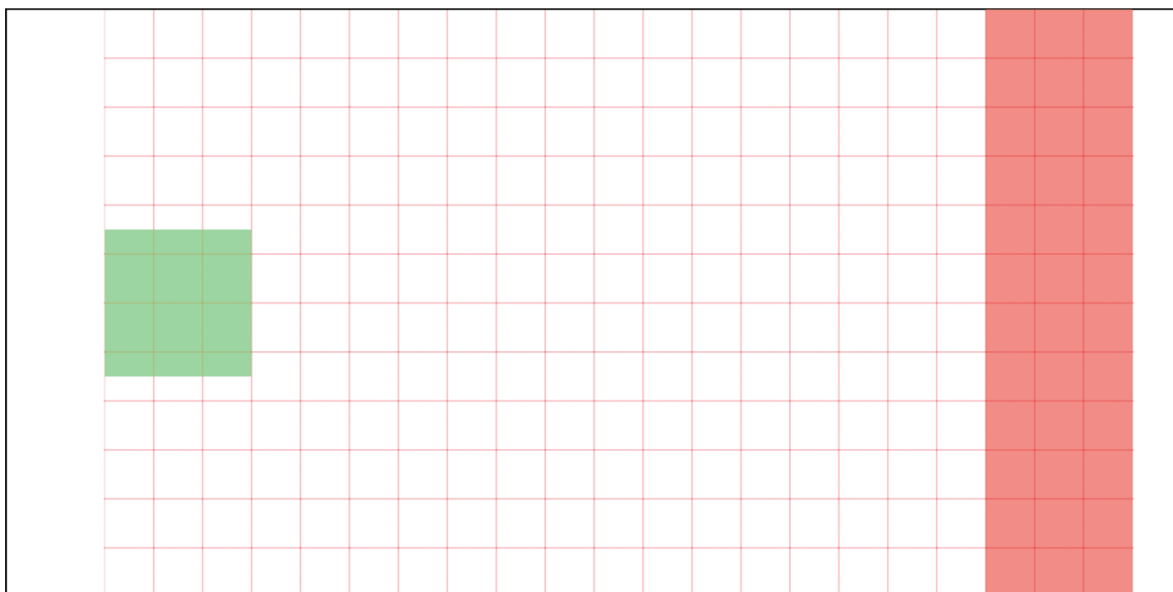
Рис. 1. Полигон